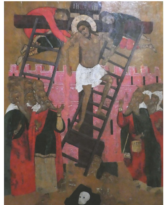
Kreuzerhöhung Jesu, Moskau 17. Jh.

Die Passionszeit ist für Christen eine Zeit innerer Einkehr, eine Zeit des bewussten Verzichts, eine Zeit der Besinnung, eine Zeit des Abstands von manchem Trubel und eine Zeit des Vertiefens in den Leidensweg Jesu – wobei jeder selber entscheide, ob und wie er sich darauf einlässt.