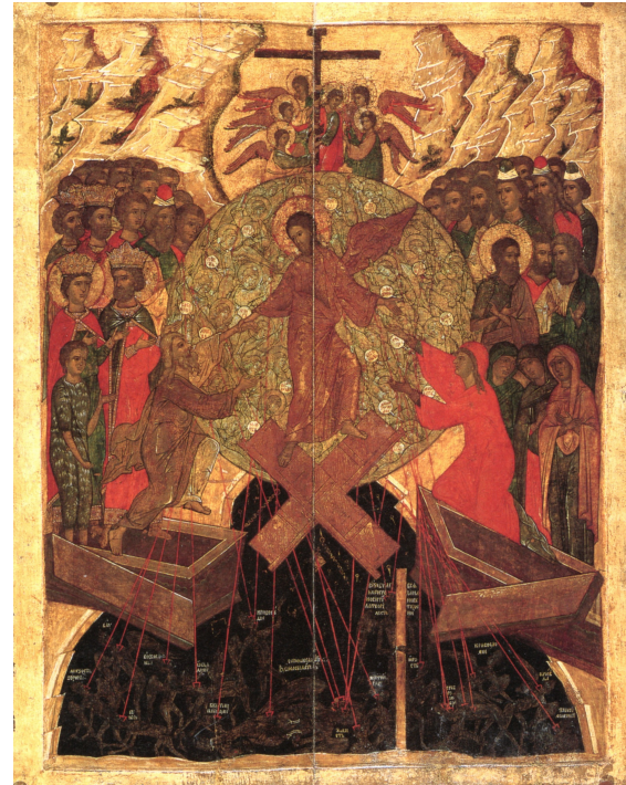
Christi Auferstehung - Höllenfahrt, 16. Jh., Staatl. Hist. Museum, Moskau